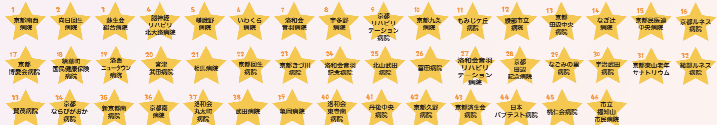
いきいき働く認定医療機関（基本認定：令和4年9月末現在）

当センターでは、平成29年1月から「京都市いきいき働く医療機関認定制度」を開始しました。職員一人ひとりがいきいきと輝ける職場づくりに取り組むことを宣言し、勤務環境改善に取り組む病院をセンターが認定します。本制度により、自院の勤務環境における課題が明確になり、認定取得に向けた取り組みを通じて職員のモチベーションを高め、さらには認定取得により働きがい・働きやすさを広くアピールすることで、人材確保・定着に繋がります。センターでは、現在、下記の46病院を「いきいき働く基本認定医療機関」に認定しています。基本認定に必要な50項目が達成できましたら、センターへ申請いただき、センターによる実施確認、認定審査会での審議を経て認定します。まずは取り組みの初めとして宣言書をセンターにご提出いただき、その後、基本50項目が達成できましたら、センターへ申請をお願いいたします。