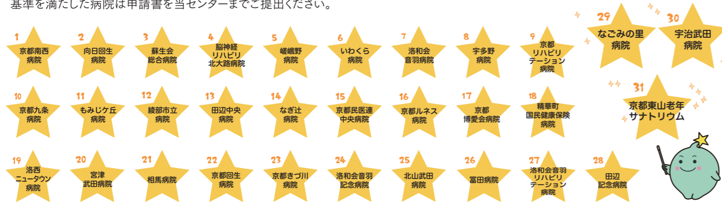
いきいき働く認定医療機関(基本認定:令和元年7月末現在)

認定までには、病院において当センターによる実施確認が必要となります。実施確認は基本認定申請書の到着順で行いますので、達成基準を満たした病院は申請書を当センターまでご提出ください。