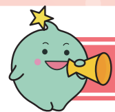
いきいき働く認定医療機関(基本認定'令和7年1月現在)