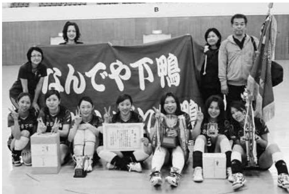
優勝 京都下鴨病院チーム