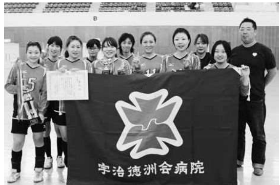
準優勝 宇治徳洲会病院チーム